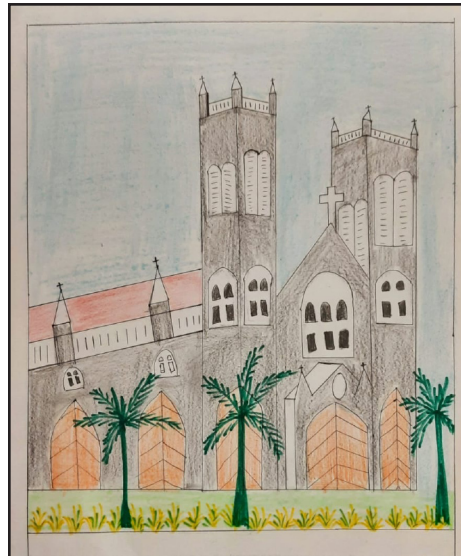
അന്ന മേരി അനുഗ്രഹാ ദാസ്